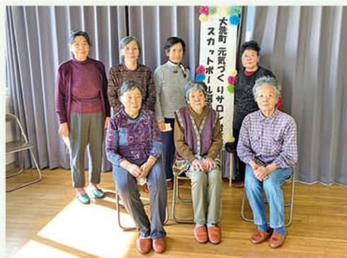
優勝した永町サロン

さらに、持ち球5個すべて入った方にできる【スカットボールパーフェクト賞】も5名が受賞し、参加した皆さんとても盛り上がっていました！！